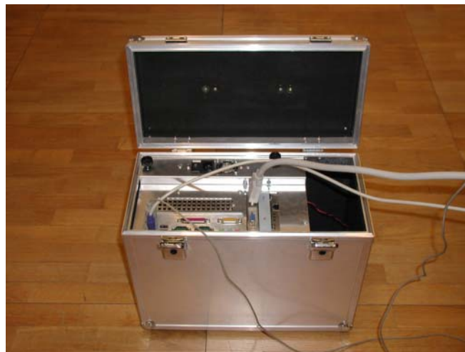
Bild 2. Mobiler PC mit Dualhead-Graphikkarte.

Für die Realisierung zweier Videokanäle bieten sich prinzipiell zwei Möglichkeiten an, welche beide aufgebaut und erprobt wurden. Die erste Lösung sieht eine Hardware vor, bei der zwei Graphikkarten oder eine Dualhead-Graphikkarte in einem einzigen Rechner integriert sind. Da dies noch nicht in einem einzigen Laptop realisiert werden kann, wurde aus handelsüblichen PC-Bauteilen eine tragbare Version aufgebaut.