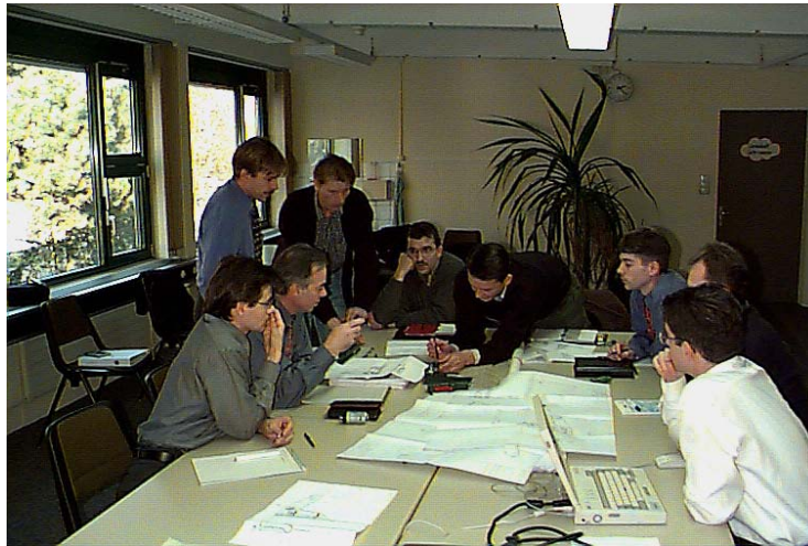
Bild 1. Schwierig zu moderierende FMEA-Sitzung.

Idealerweise sollte eine FMEA von einem interdisziplinären Team durchgeführt werden. Dies hat zur Folge, dass nicht notwendigerweise alle Teilnehmer die vorhandenen Informationen gleich gut verstehen können, beispielsweise bei 2D-CAD-Zeichnungen oder bei FEM-Berechnungsergebnissen. Auch eventuell vorhandene 3D-Modelle oder Teile sind häufig nur einmal vorhanden und können somit nicht dem gesamten Team gleichzeitig visualisiert werden. Zeichnungen vermitteln immer nur eine Ansicht und können nicht nach Belieben verändert oder gedreht werden. Dies hat zur Folge, dass nicht immer alle Teilnehmer an der Sitzung aktiv teilnehmen können.