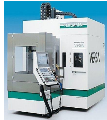
Abb.3: 5-Achs Bearbeitungszentrum Fehlmann Picomax Versa